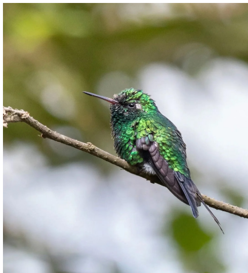
La Esmeralda Mexicana (Cyanthus auriceps)

Ésa, según cuentan los más sabios de los pueblos más antiguos, es la razón por la cual los colibríes saltan de flor en flor y se alejan volando rápidamente hasta perderse entre las nubes.