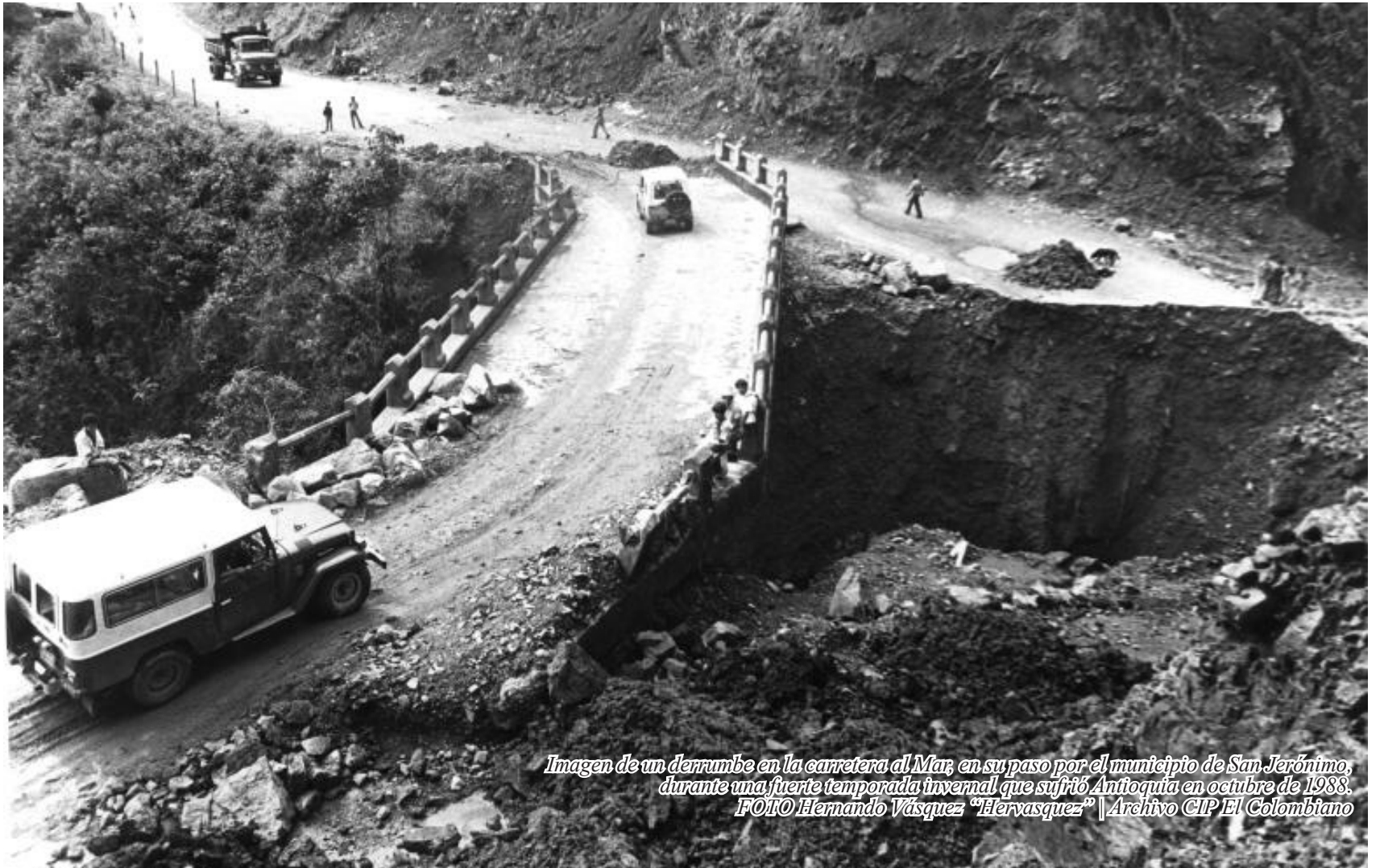
Imagen de un derrumbe en la carretera al Mar, en su paso por el municipio de San Jerónimo, durante una fuerte temporada invernal que sufrió Antioquia en octubre de 1988.

Por: Juan Diego Ortiz Jiménez - El Colombiano.